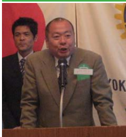
横浜ベイスターズ広報