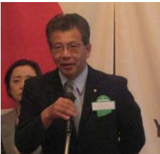
同副委員長 新横浜 RC

皆様こんにちは。日頃より、国際青少年交換学生のプログラムには大変ご協力いただきまして、ありがとうございます。この度は受入れ学生側より来日中止の連絡があり、大変残念ですがお伝え申し上げます。横浜緑ロータリークラブさんに於かれましては、受入れホストクラブとして、ご準備戴いておりましたのに、申し訳ありませんでした。委員会としても安全地域であることを伝えましたが、不安を払拭することができませんでした。ただ日本の学生は受入れ可能とのことで、良かったとおもいます。今後とも何卒ご協力いただきたくよろしくお願い申し上げます。